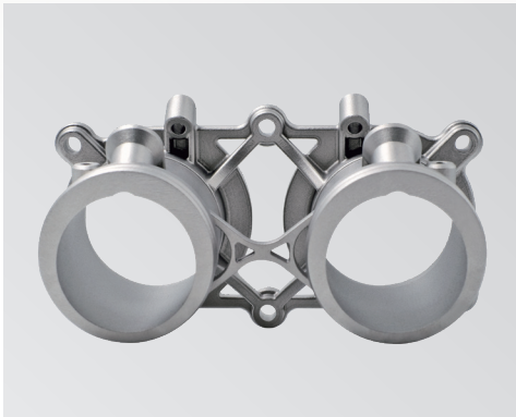
样品名称：赛车喷油器支座 打印设备：FS273M 打印材料：FS AlSi10Mg

该部件是发动机喷油器的支座，为了防止燃油泄漏产生意外，就要保证各个喷油器支座之间的间距相等，如采用传统铣削工艺来制作，一是加工难度大，需要五轴数控铣床才能加工出来；其次是铣削量较大，材料利用率不高；而采用3D打印技术既可提高材料利用率，又能实现轻量化设计后复杂结构的生产要求。